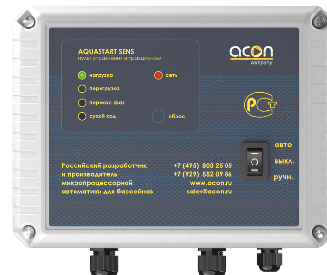
Рисунок 1 - Лицевая панель корпуса

Кнопка «СБРОС» для вывода ПУ из заблокированного состояния